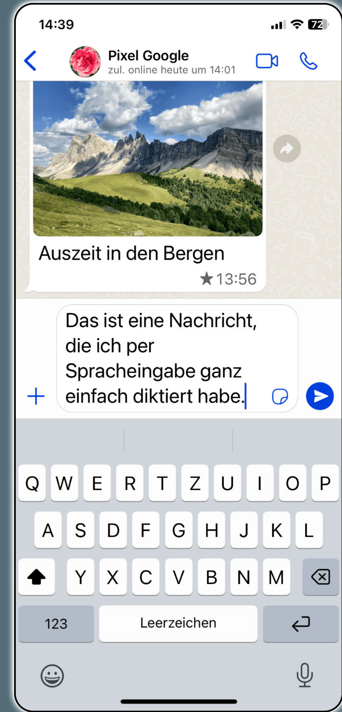
Der diktierte Text kann noch korrigiert werden.